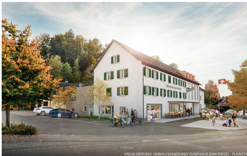
VISUALISIERUNG UMBAU/SANIERUNG GASTHAUS ZUM ENGEL · FLAACH