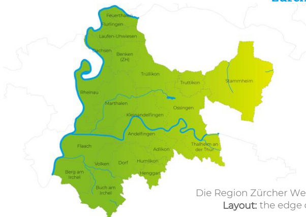
Die Region Zürcher Weinland im Überblick. Layout: the edge creative solutions ag

Der Standortförderverein ProWeinland tritt seit diesem Jahr im Rahmen seiner Tätigkeit für die Umsetzung der Neuen Regionalpolitik als Regionalmanagement Zürcher Weinland auf. Hierfür wurde eine Geschäftsstelle an der Weinlandstrasse 12 in Kleinandelfingen eingerichtet und in Betrieb genommen. Die Geschäftsstelle ist von Montag bis Donnerstag zu festgelegten Zeiten (09.00 – 12.00 Uhr und 14.00 – 17.00 Uhr) besetzt.